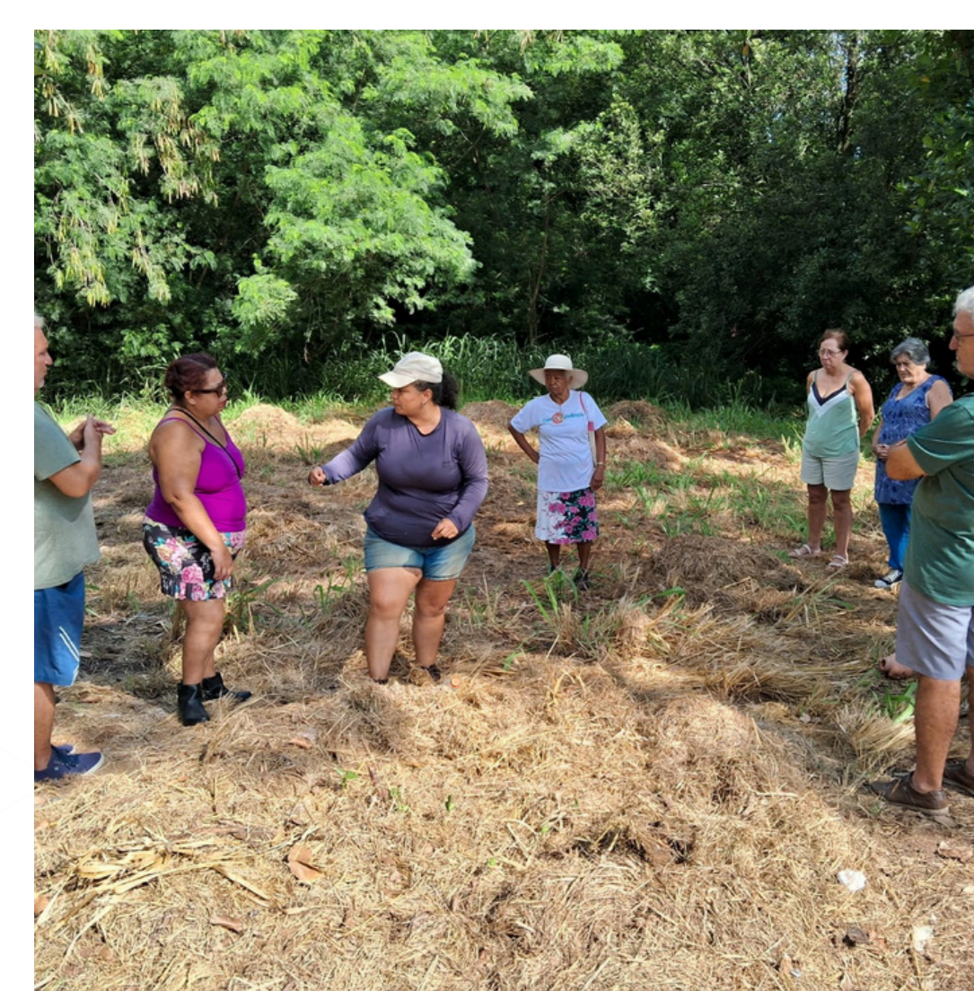
Ecologia e Jardinagem